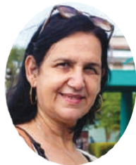
Por: María Isabel Perdígón

Los periodistas suelen decir que el mejor reportaje siempre es el próximo. Quizás por eso un periódico jamás termina de escribirse. Cada día vuelve a empezar, cada amanecer exige nuevas preguntas, nuevos recorridos, nuevas historias.