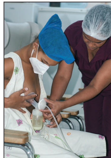
El Banco de Leche Humana del hospital es otra muestra de los apoyos de Unicef recibidos a lo largo de los años en la institución de Salud

La leche se usa en el servicio de Neonatología, pero también en las unidades intensivas pediátricas en niños malnutri-