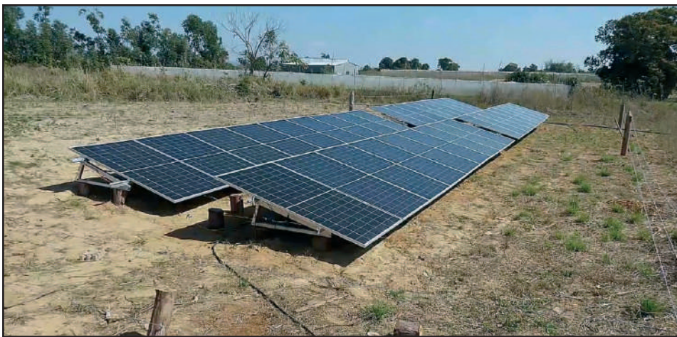
Los módulos fotovoltaicos asociados al cultivo de la hoja han venido a bien para el desarrollo óptimo de la campaña

“Estamos creciendo y dando pasos sólidos que en un futuro cercano nos permitirán ser mucho mejores en el cultivo de la hoja, y hoy esta campaña lo está demostrando. Gracias a los incentivos para la cosecha otorgados por Tabacuba, a la instalación de los sistemas fotovoltaicos, a la conciencia y voluntad de los propios productores y al despertar masivo que hemos visto, Consolación del Sur será, sin duda alguna, el bastión que siempre fue, situándonos nuevamente en el lugar cimero que siempre hemos tenido dentro de la cosecha del tabaco a nivel nacional.