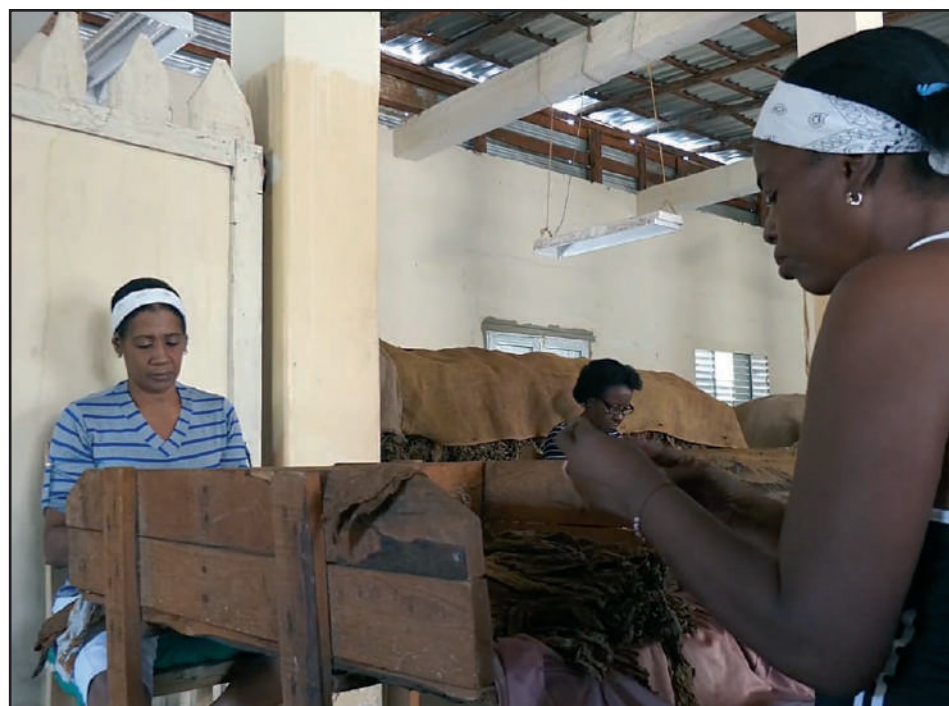
A pesar de que la fuerza de trabajo en las escogidas ha fluctuado, hoy no es un problema

puestas en los diferentes lugares, con la presencia de equipos de riego sobre la base de la energía fotovoltaica que abarcan más del 40 por ciento de las áreas”, aclaró el directivo.