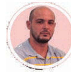
Por: Ariel Torres Amador

El tema que le propongo esta semana ya lo hemos tratado en otras ocasiones disfrazado en diversos matices; sin embargo, el asunto a veces requiere de un guiño, o “un toque” si se quiere para tomar un segundo aire, dar una segunda lectura y repensar y poner las cosas en la perspectiva correcta.