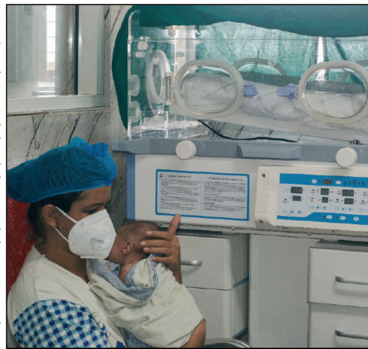
Con anterioridad a la sala de Neonatología fueron donadas por Unicef mantas térmicas e incubadoras para los recién nacidos que allí reciben atención