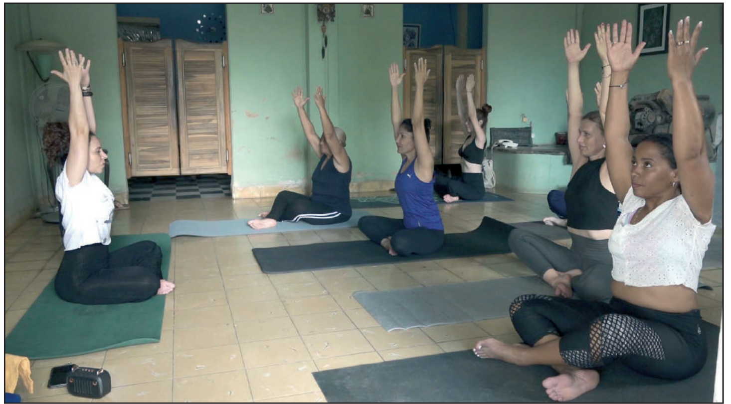
La práctica regular del yoga repercute positivamente sobre la salud física y mental, al mejorar la flexibilidad y fuerza, reducir el estrés y la ansiedad

Desde este espacio creó Rizoma Yoga "un proyecto en el que he intentado enseñar a otros que todos tenemos la capacidad de sanar, y se convierte en una comunidad donde cada día somos más guiados por una práctica enfocada en el bienestar de la salud física, mental y espiritual".