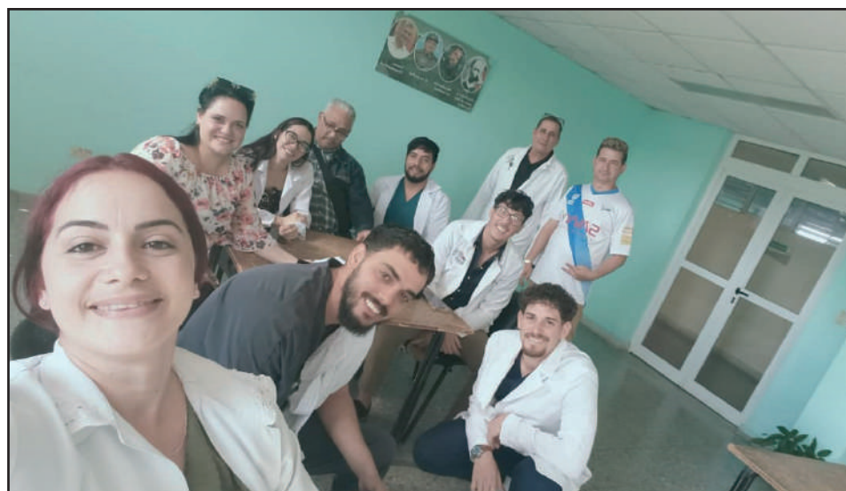
Frente al salón de Cirugía del pediátrico Pepe Portilla, el equipo coincide en que la vocación de servicio y amor por los niños prima entre sus integrantes

“Las especialidades clínicas van mucho al libro y al paciente, pero nosotros tenemos que operar. Hay que dominar el cuadro clínico, pero las técnicas quirúrgicas se aprenden viéndolas y haciéndolas. Hoy damos seminarios, hablamos mucho, orientamos revisiones de temas y cuando hay un caso se les avisa a todos para que