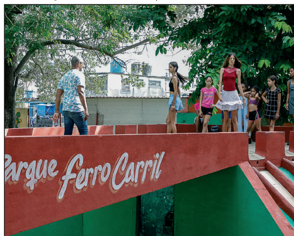
Pasarelas, espectáculos con magos y payasos son algunas de las actividades que el parque ofrece para los más pequeños