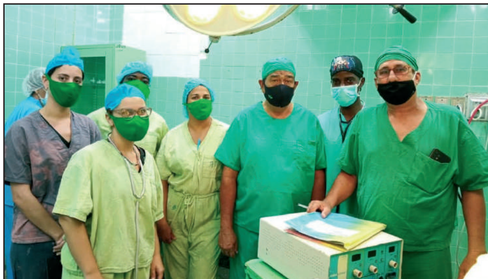
En imágenes comparten residentes y especialistas en Cirugía Pediátrica espacios comunes del servicio

Por Dorelys Canivell Canal