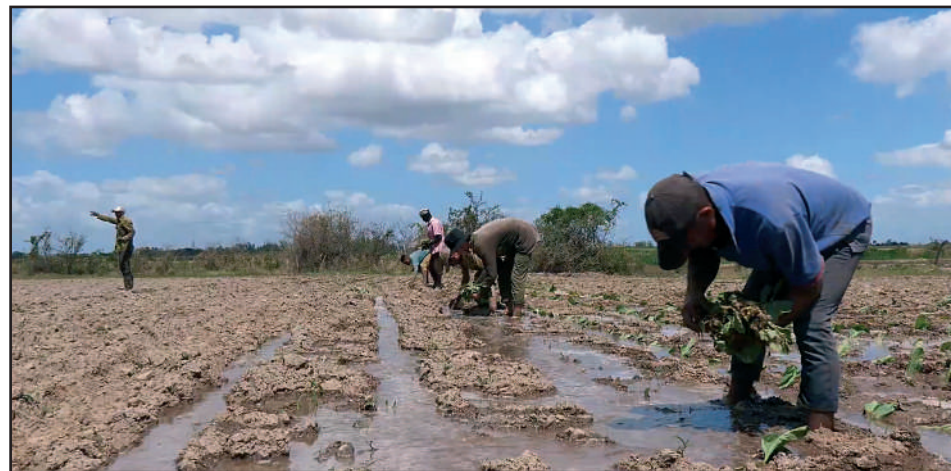
La “26 de Julio” hoy se recupera de su deuda económica, y en sus campos es plausible la enorme ventaja de los sistemas solares de riego