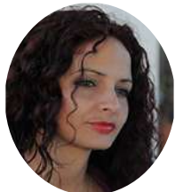
Por: Dorelys Canivell Canal

Y las personas hacen las denuncias personalmente y también en las redes, que ya no aguantan más, como La Habana, pero hay oídos sordos a tales reclamos, porque no se aprecia una transformación