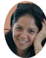
Por: Heidy Pérez Barrera

A UNQUE pasen los años, hay amañeceres que no se olvidan, así lo avalan los testimonios de quienes vivieron los días de Girón, no solo por el estruendo de las armas o la tensión evidente en cada rincón, sino por la certeza de que allí se defendía algo más que un territorio, se defendía un sueño.