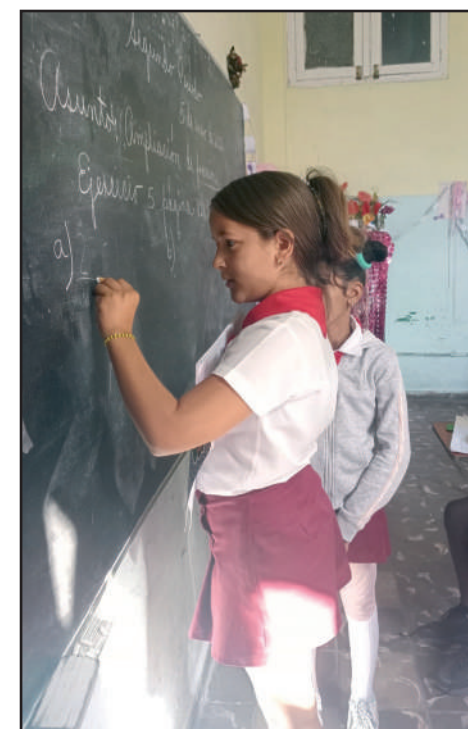
Ha sido profesora de sus actuales alumnos de cuarto grado desde que comenzaron la enseñanza Primaria, en primer grado

En la vida de esta profesora, ser maestra de Primaria es su mayor satisfacción, pues le fascina enseñar a los más pequeños. "Me gusta mucho el trabajo con los niños, ver cómo desde cero va creciendo el interés de saber más cada día, por eso, sin pensarlo dos veces, si volviera a nacer, sería maestra de la enseñanza Primaria".