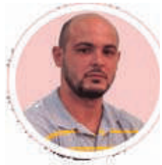
Por: Ariel Torres Amador

Luchar y resistir cada día el tema del tope de precios ya en sí es sumamente difícil, como para que también usted, yo,