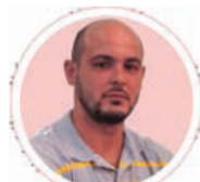
Por: Ariel Torres Amador

También, nuestra idiosincrasia ha sabido poner en alto la estirpe que nos llena, y desde varias provincias nos ha llegado avituallamiento y otros recursos de los que carecíamos, y que hoy nos han resultado más que útiles.