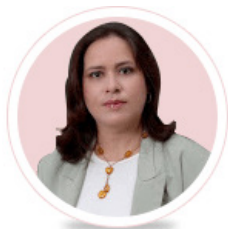
Por: Yolanda Molina Pérez

No llevan el peinado de siempre, perdieron la simetría y la corona, sus melenas de un verde intenso, cuando no cayeron, quedaron volcadas hacia un solo lado, el último hacia el que las inclinaron las ráfagas de vientos; la mayoría siguen erguidas, aunque maltrechas.