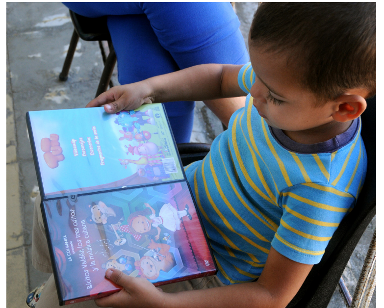
El amor por la lectura es una de las prioridades que la miembro de la Uneac de Artemisa llevó a San Diego