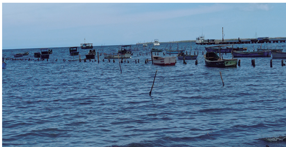
Aunque varias embarcaciones deportivas sufrieron daños en su estructura, la mayoría de ellas ya están listas para que sus dueños salgan de pesquería