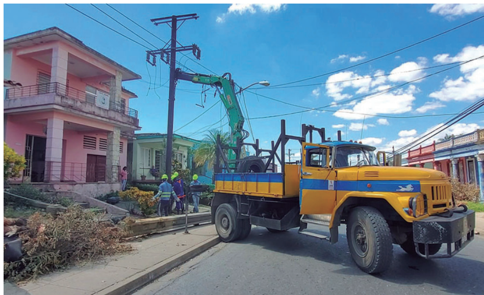
Una de las tareas más fuertes ha sido sin duda la que han tenido que enfrentar los eléctricos, que junto a sus iguales de Etecsa, no han tenido descanso alguno

"Actualmente tenemos más de 1 500 clientes con servicio, desagregados desde el Crucero de la Leña a Cuatro Caminos, pasando por el consejo popular de