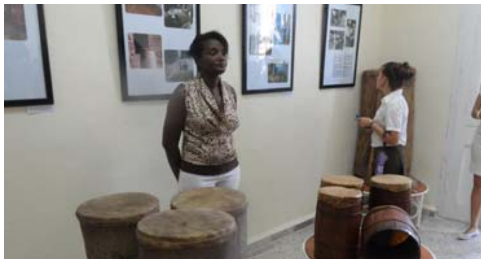
El "Argeliers León" atesora las memorias musicales pinareñas y colecciones de importantes artistas del país

Entre las colecciones o fondos personales que integran hoy el patrimonio museable del centro se incluyen documentos y objetos relacionados con creadores reconocidos en la provincia, el país o el extranjero como es el caso de Pedro Junco, Aldo Carrazana, Néstor Pinelo Cruz, Polo Montañez, José Miguel Caleyo, Francisco Valdés González,