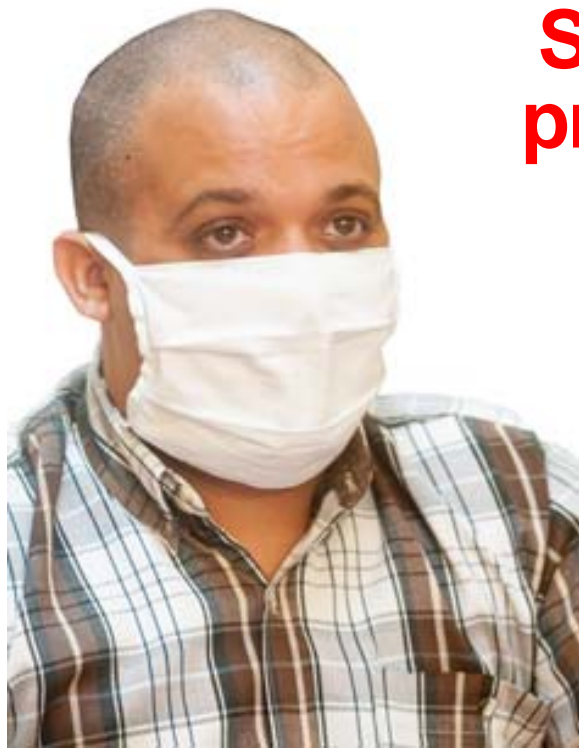
Liosbel Márquez García, presidente del Tribunal Provincial Popular

L A presencia en Cuba del SARS-Cov-2 ha modificado temporalmente la vida de las instituciones y de la ciudadanía. Los órganos encargados de impartir justicia en el país también han adaptado sus rutinas a la situación imperante.