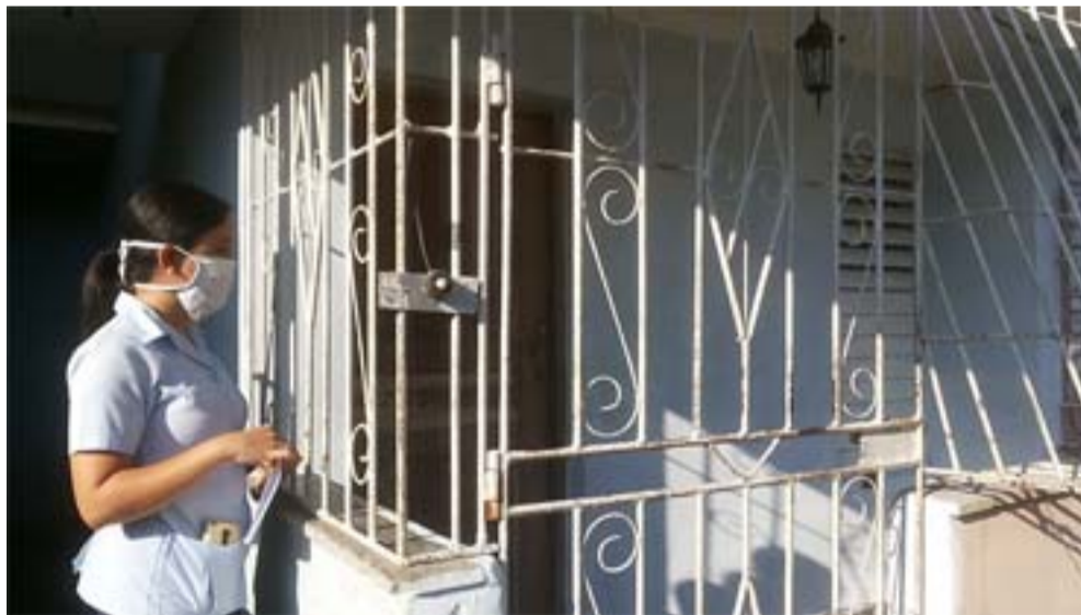
Tomar cada dato a las personas pesquisadas facilita el seguimiento estable en caso de contraer algún riesgo

Precisamente, en esa interacción y en la búsqueda temprana de cualquier