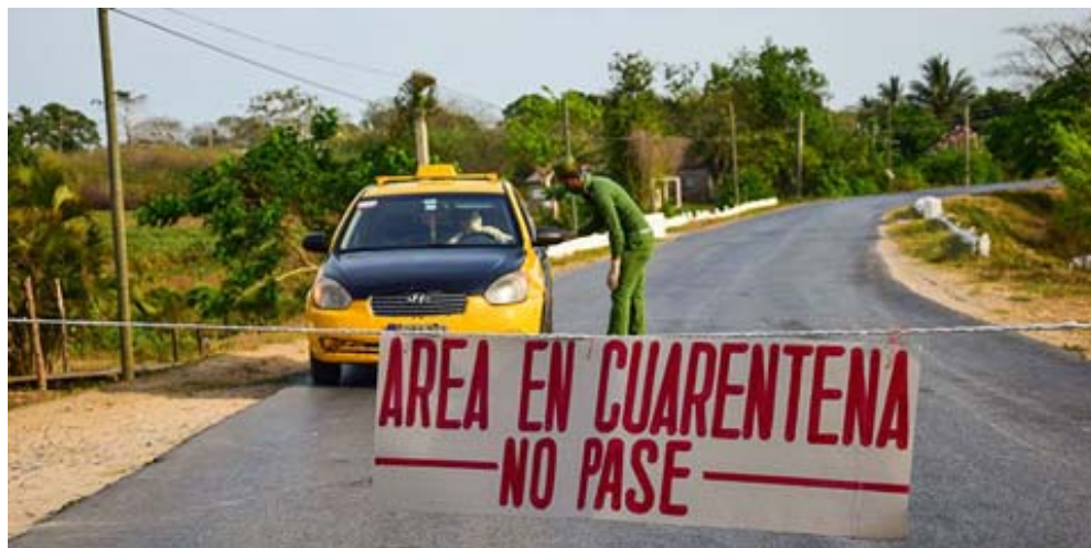
Primer cordón de seguridad en la zona de cuarentena comprende 131 viviendas con 288 personas residentes en ellas

Otro aspecto sobre el que poner la atención en cuanto a la gestión de esta situación epidemiológica es la habilitación de cinco puntos de control sanitarios