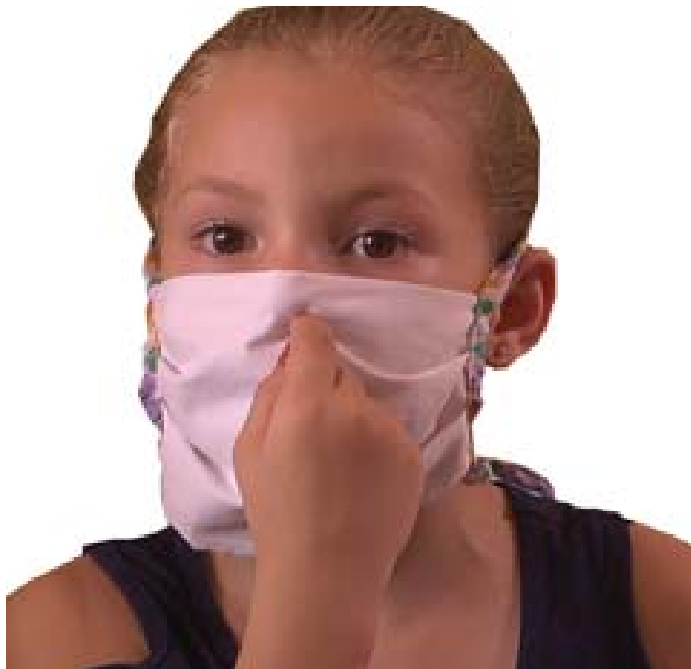
La pequeña explica el tratamiento médico recibido durante su hospitalización

La pequeña con apenas seis años no comprende la magnitud de la experiencia, eso sí, al preguntarle cómo se portó en el hospital, dice que bien, porque a ella nunca la inyectaron: «Me echaban unas gotitas por la nariz con una jeringuilla, dejaban la mitad y después por el otro huequito».