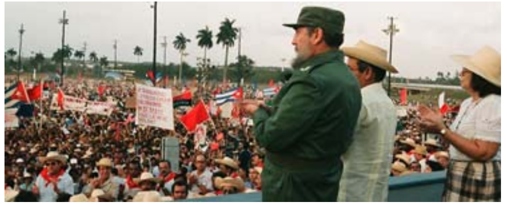
Fidel acompañó a los pinareños en el acto por el Día Internacional de los Trabajadores celebrado el 30 de abril de 1988