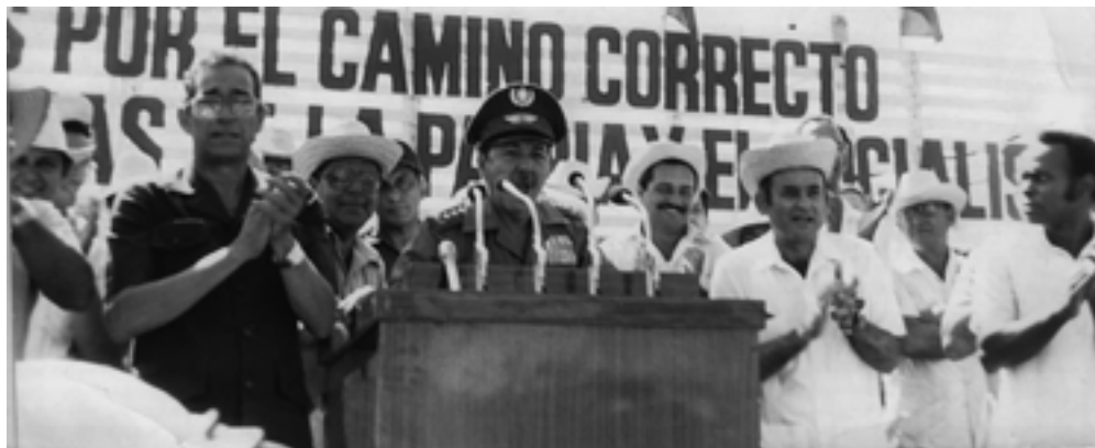
Raúl en el acto por el Primero de Mayo efectuado en Pinar del Río en 1987

«Cualquier industria por compleja que sea, por difícil que sea, los pinareños serán capaces de construirla y de hacerla funcionar con eficiencia», aseveró.