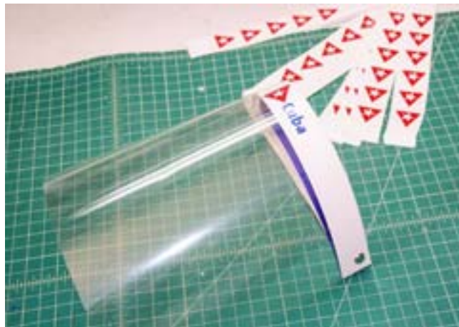
La marca país-Cuba- presente en las máscaras faciales

Desde hace unos días esta pareja se volcó en la fabricación de máscaras de protección para galenos, enfermeros y