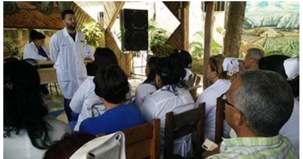
Las audiencias sanitarias cobran especial importancia en estos momentos

«La provincia está preparada, la capacitación es continua, los recursos de salud y humanos están listos para asumir la tarea. No hay problemas con los medicamentos, el alcohol, el yodado, la medicina verde. Sobre esto último, se produce la tintura de cebolla, el té, el jarabe imefasma, el hipoclorito, tanto para