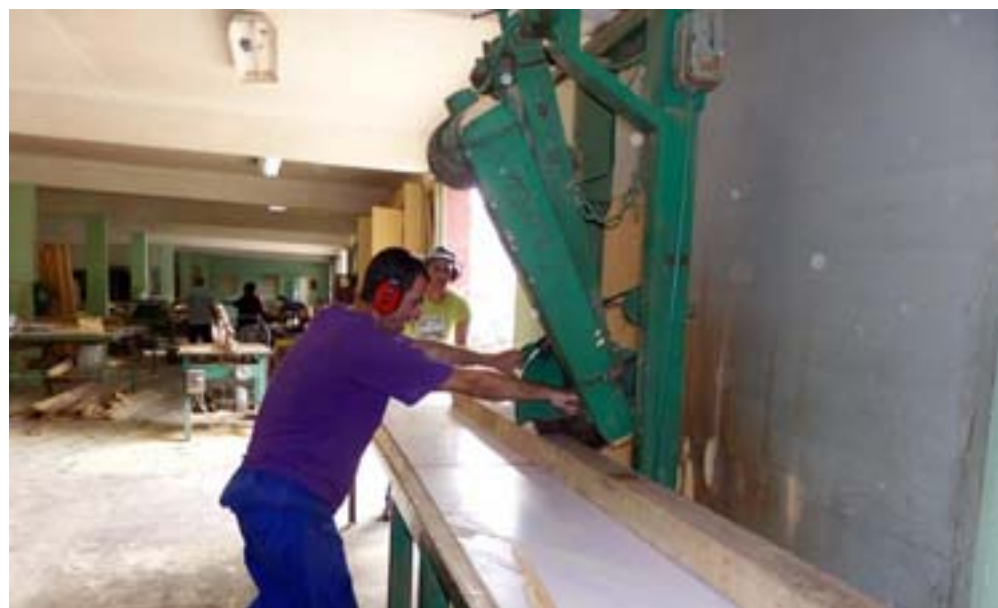
La sierra hace maravillas, hasta el más gigante es reducido a pequeño

formados por sus sillas y mesas plegables, una petición personal del importador para explorar mercado.