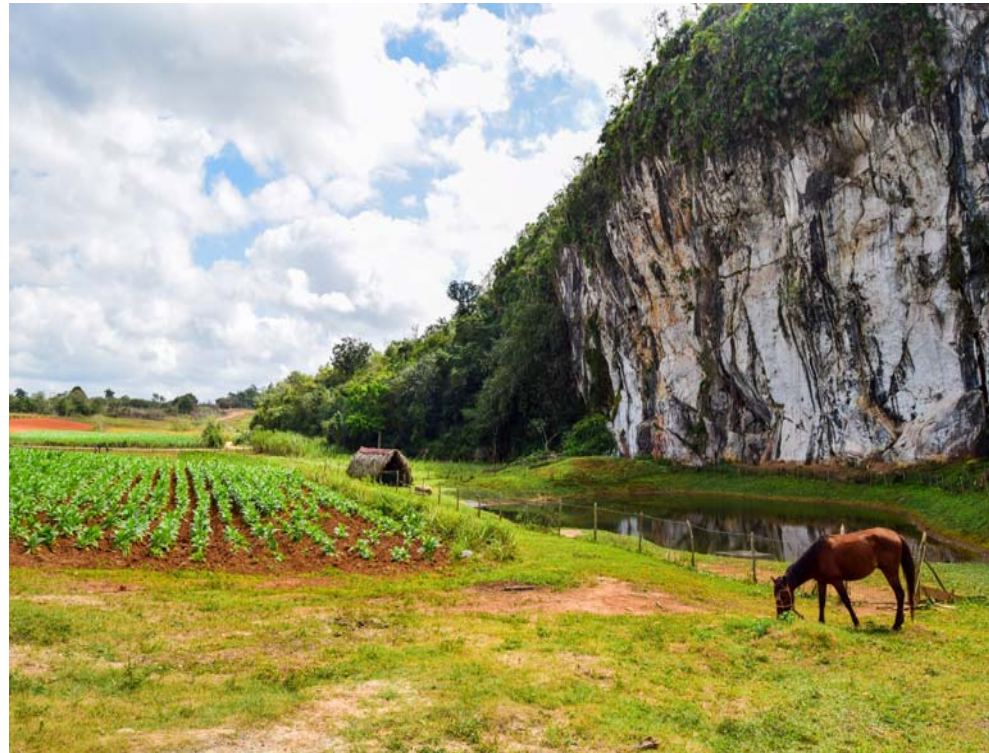
En la finca se cultiva 42 variedades de hortalizas, granos y viandas

después de su retiro, quiso rescatar las tierras de su suegro para ponerlas a producir.