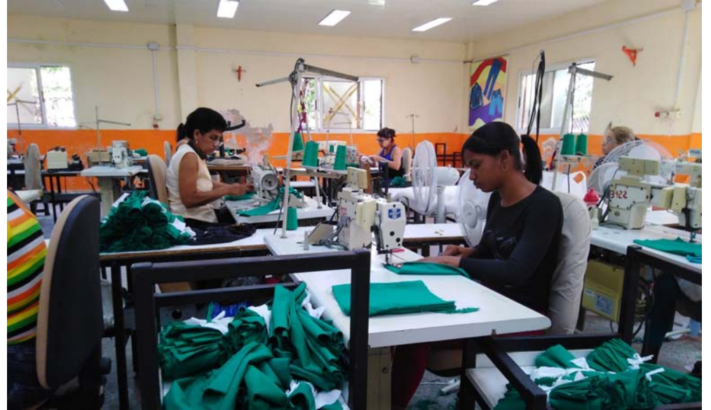
En los talleres de costura de la provincia confeccionan nasobucos para instituciones de la Salud