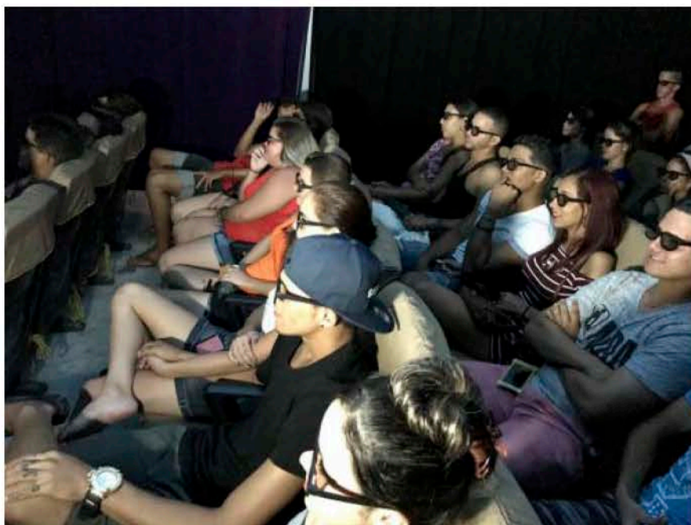
A pesar de que la mayoría de las películas en 3D son animadas, puede verse la diversión en un público de diferentes edades

El «Avellaneda» proyecta además multimedias en formato normal, pero no son tan perseguidas y solicitadas como sus homónimas estereoscópicas.