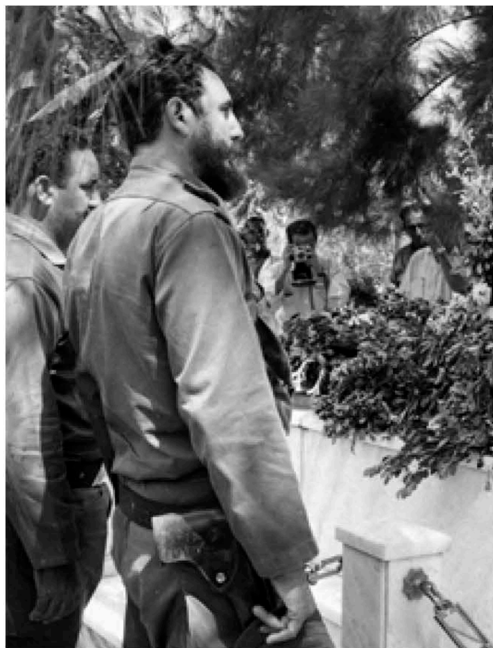
Imagen que le publicaron con solo cinco años. A lo lejos la figura de Korda fotografiando a Fidel