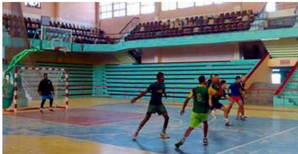
El tren de la victoria busca devolver el balonmano pinañero a la elite

La octava edición de la copa de balonmano El tren de la victoria, categoría escolar, comenzará el 15 de noviembre y rendirá tributo a la conmemoración del Día de la Cultura Física y el Deporte.