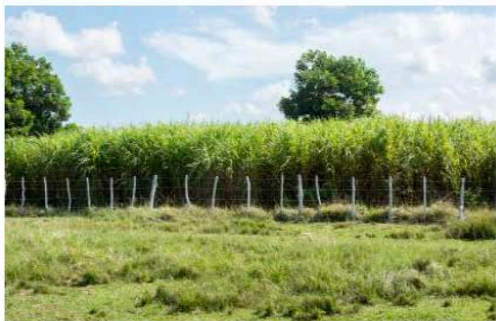
La siembra de pasto es una actividad priorizada por los ganaderos