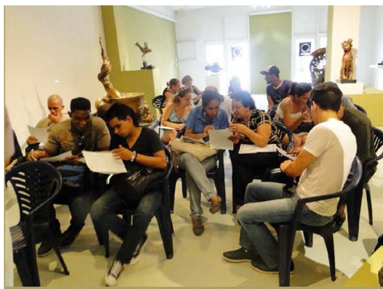
Una de las sesiones del taller para adultos

El arte saca del inconsciente esas experiencias y las traduce en símbolos. Entender al hombre significa comprender los símbolos que él crea en su vida en sociedad. Por tanto, el arte es el medio para la comprensión del mundo.