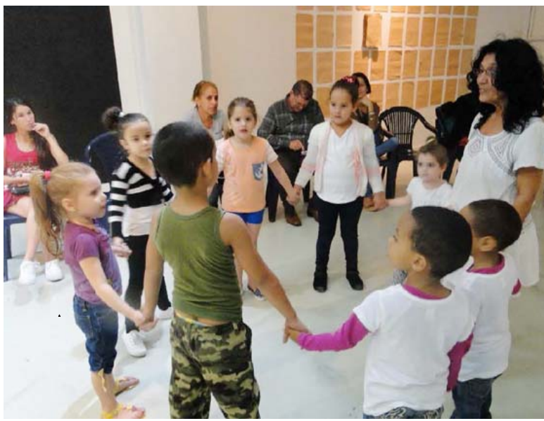
"Farmacia" trabaja con niños en el Mapri

"El taller es lúdico. No impone a los niños cómo representar, aunque sí tenemos temas específicos, propios de la edad. (...) Es inclusivo. Los padres los traen por razones diversas: algunos no socia-