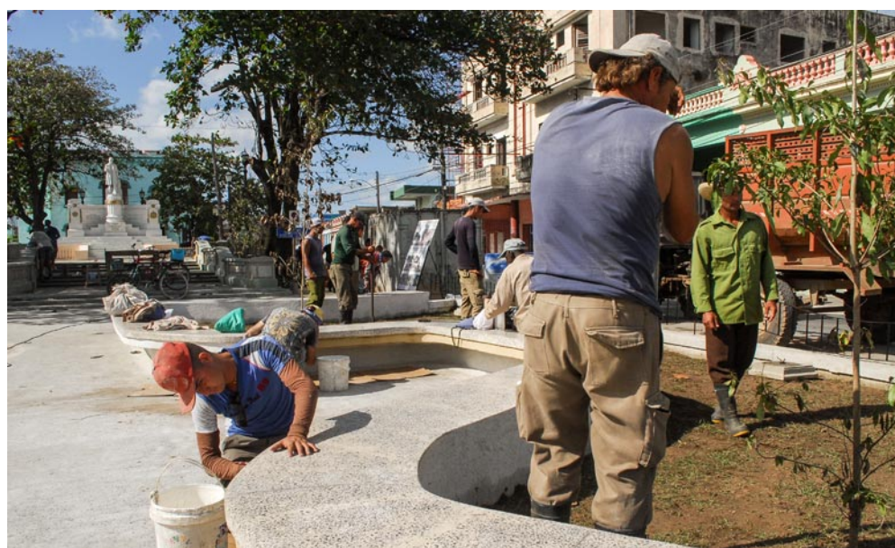
Al cierre se daban los últimos toques que dejarán listo el parque Martí.