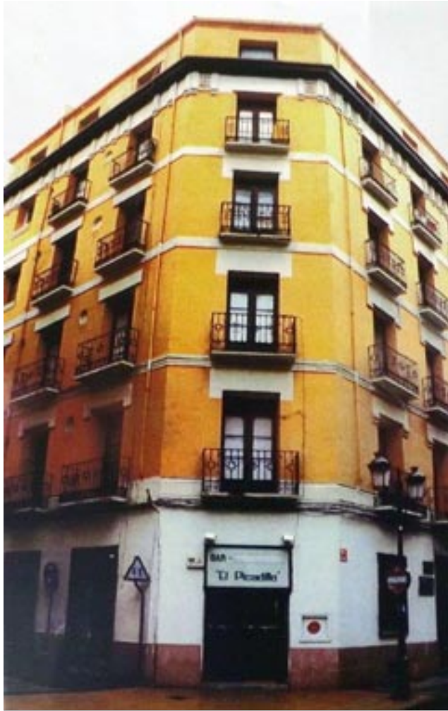
La vetusta casona en la calle Manifestación no. 13

Por Mónica Brizuela Chirino y Ramón Brizuela Roque