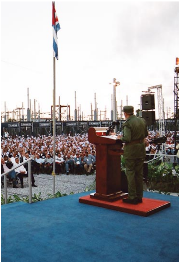
Fidel Castro Ruz en el acto por la instalación de los grupos electrógenos en Pinar del Río y la inauguración de la Revolución Energética, el 17 de enero del 2006