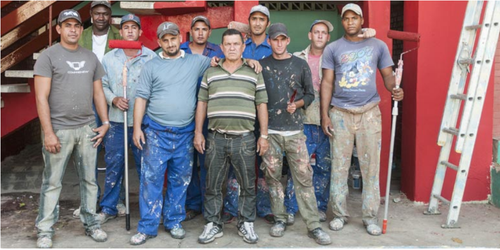
Esta brigada, integrada en su mayoría por jóvenes, tiene el trabajo como baluarte, como un modo digno de ganarse la vida

Por Ana María Sabat González