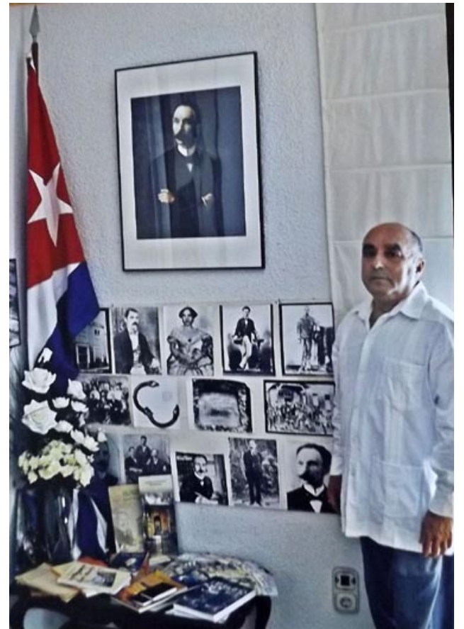
El rincón martiano que crece con su esfuerzo

Este mensajero de la cultura, un desenvuelto conversador y contador de historias, no ha perdido sus raíces y mantiene un