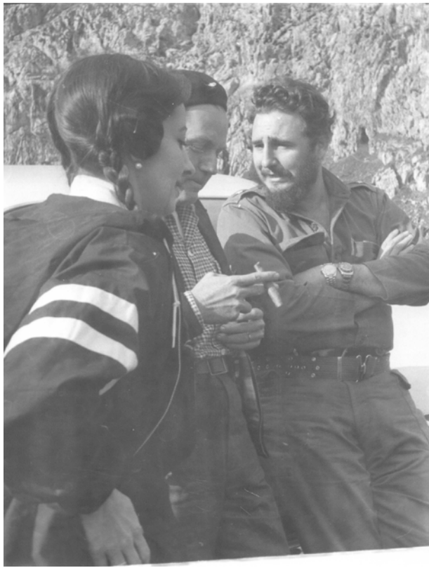
Fidel Castro Ruz con Alicia Alonso en el Valle de Viñales en enero de 1960

¡47 años después, la otrora Cenicienta brillaba con más luz.!