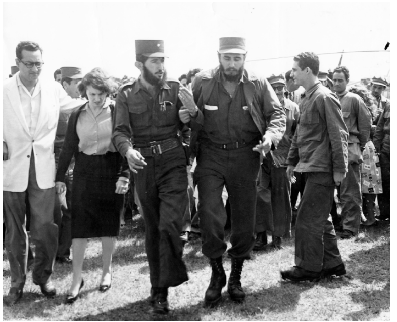
Acompañado por el comandante Dermidio Escalona, jefe del Frente Guerrillero de Pinar del Río, recorre áreas del cuartel Rius Rivera, el 17 de enero de 1959