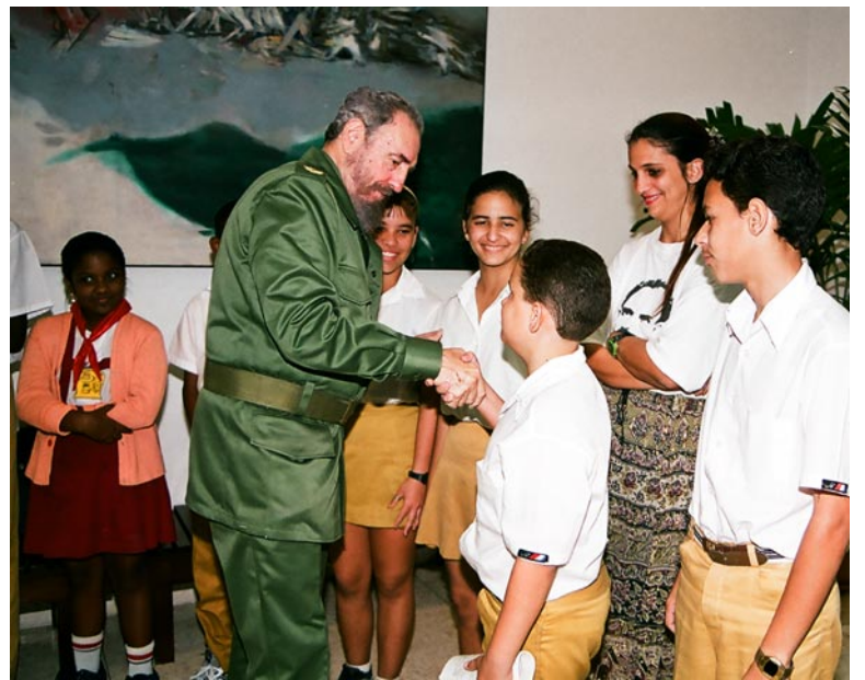
En la reinauguración del Palacio de Computación de Pinar del Río, el 17 de enero del 2001. Al concluir el acto saluda a los pioneros