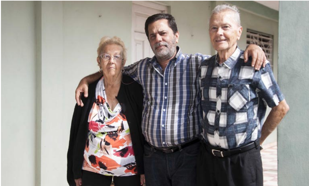
Encuentra Valín en sus padres el sostén y abrigo familiar.