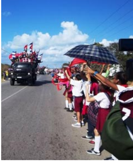
El pueblo se reunió para el paso de la Caravana.