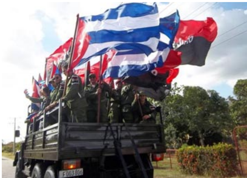
La Caravana recorrió Consolación del Sur.