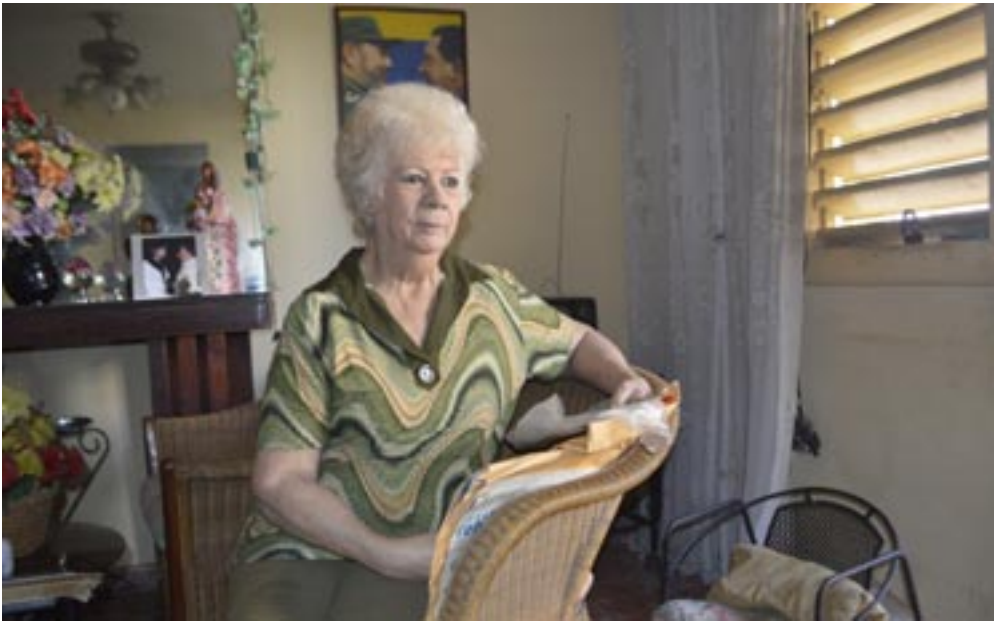
“Todo lo haría de nuevo con tal de ser útil a mi país”, asegura