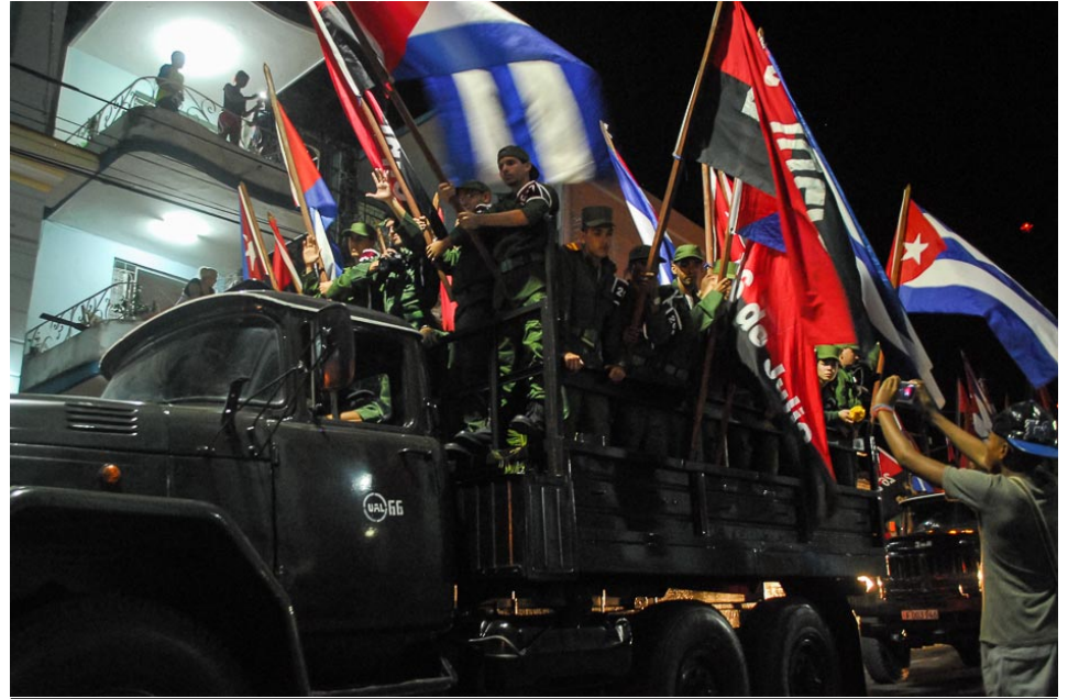
La entrada a la ciudad estuvo acompañada por una multitud.

Este 17 de enero todos fueron Fidel, y sintieron como suyo el deber de preservar sus ideas y continuar edificando su obra. Cuando finalizó el acto se pudo ver a muchos Fideles camino a casa.