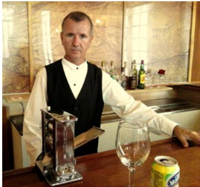
La idea del minitrapiche se le ocurrió hace algunos años con el propósito de realizar cocteles con guarapo sin que el líquido pierda sus propiedades