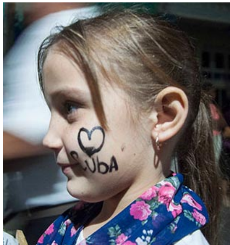
Los pinareños aman a Fidel y a su Revolución.