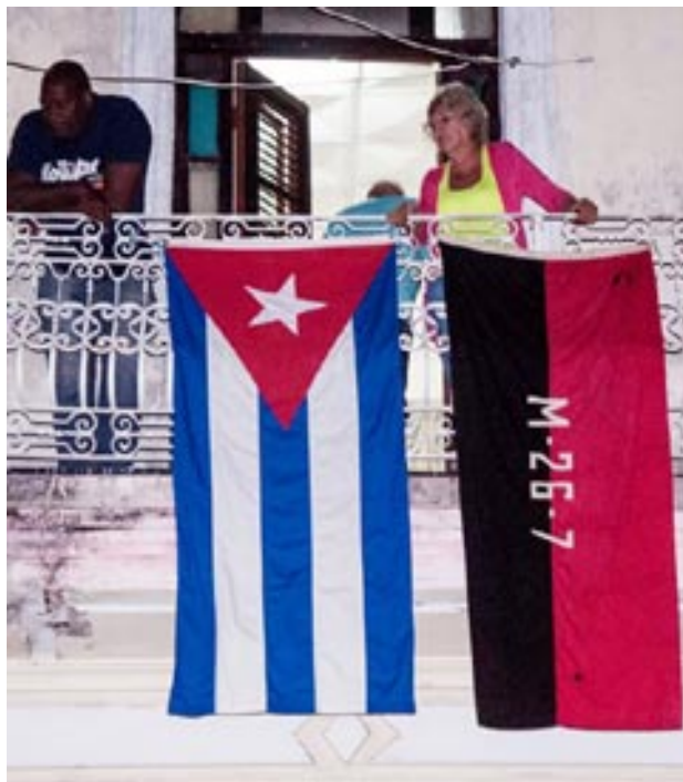
Desde los balcones saludaron a los caravanistas.