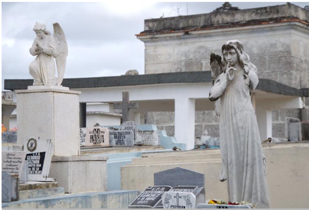
Los cementerios debieran ser sitios sagrados para todos

“A veces fallecen y no poseen el carné de identidad, en otros casos no tienen acompañantes, y hay que esperar a que