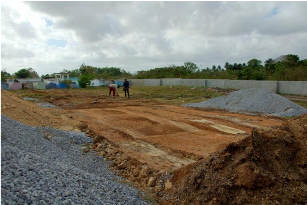
En el Cementerio Municipal se preparaban los terrenos para la construcción de los nichos