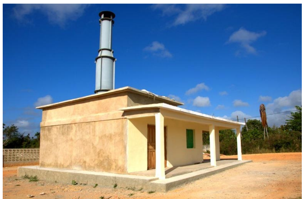
Cuando comience a funcionar el incinerador solo garantizará espacio en osarios