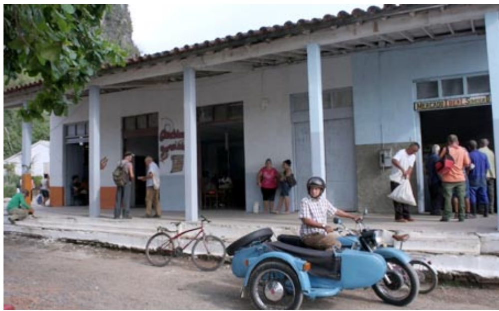
La concentración de servicios alrededor del parque permite que cualquier poblador solucione varias problemáticas en un corto plazo

No importa si es municipio o consejo popular, lo verdaderamente significativo es que quienes vivan allí, tengan garantizados los servicios necesarios.