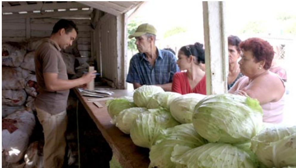
Varios vecinos dieron fe de que la presencia de productos en el quiosco de la Agricultura Urbana es habitual

Esta escuela es una de las cuatro que integran la zona educacional cinco: Antonio Maceo, en Hoyo Colorao; Ceferino Fernández, en Gramales; y Manuel Ascunce,