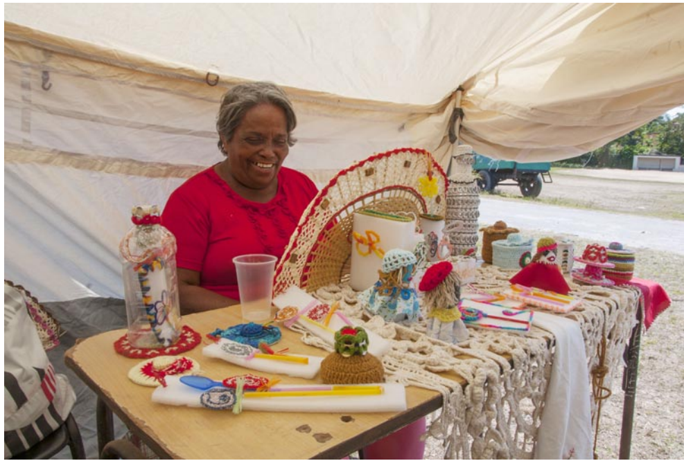
El reciclaje constituye una vía para aminorar costos en la creación artesanal

"Durante el periodo especial, vestía a mis niños con ropas viejas. El pantalón que no servía le buscaba los pedacitos nuevos, los combinaba con otros y hacía piezas de vestir, cubrecamas, paneras; con las botellas hago adornos, y el cartón tiene múltiples usos", argumenta.