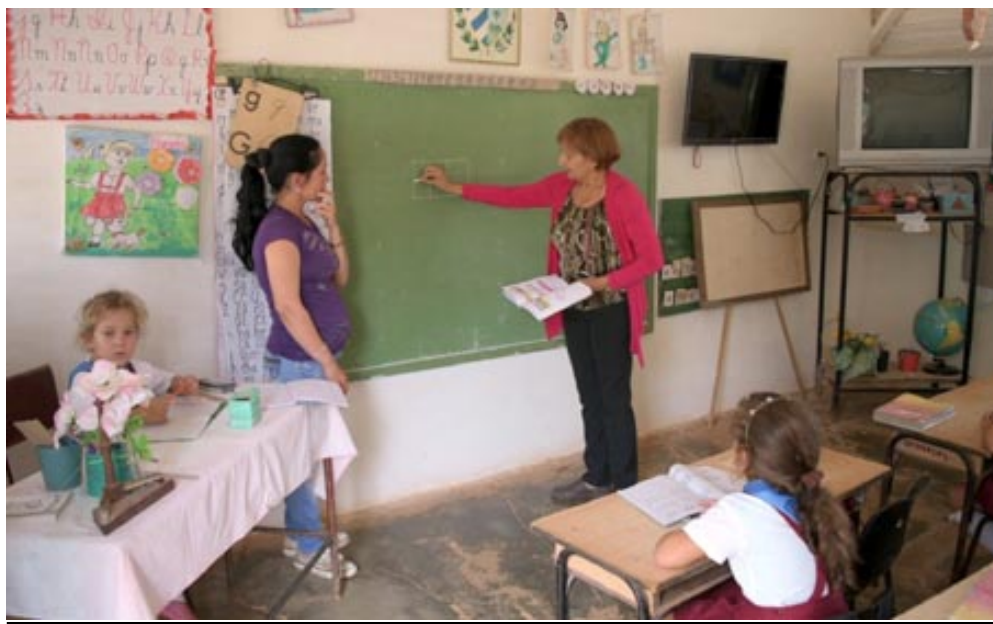
El estado constructivo de la escuela no es el mejor, pero cuentan con los medios para asegurar la calidad del proceso docente educativo