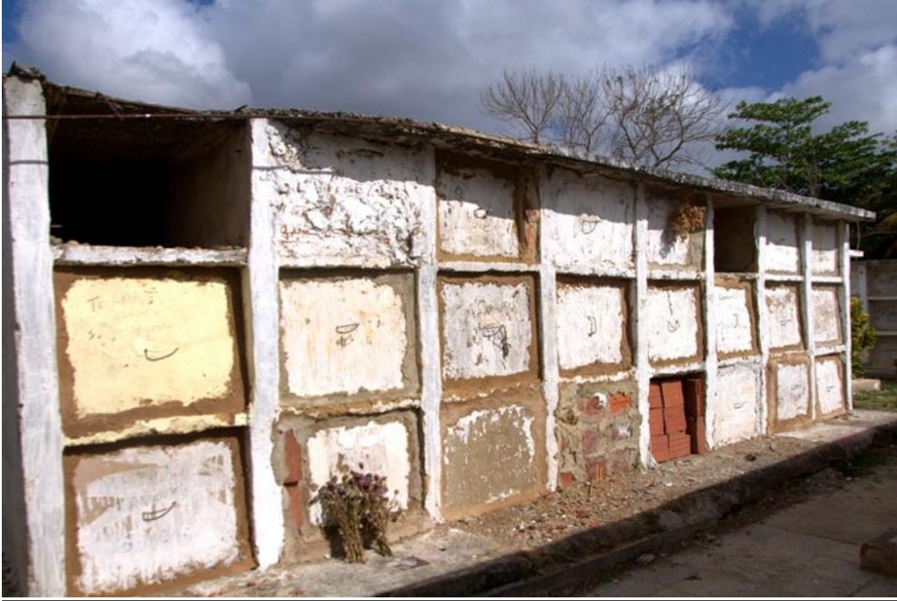
El nicho ocho en el "Agapito", presenta un estado constructivo deplorable

El directivo aseguró que el mantenimiento constructivo del camposanto de La Coloma se hará este año, mientras, para el 2019 prevén un crecimiento en superficie de los de San Carlos, Minas de Matahambre, Consolación del Sur y La Palma.