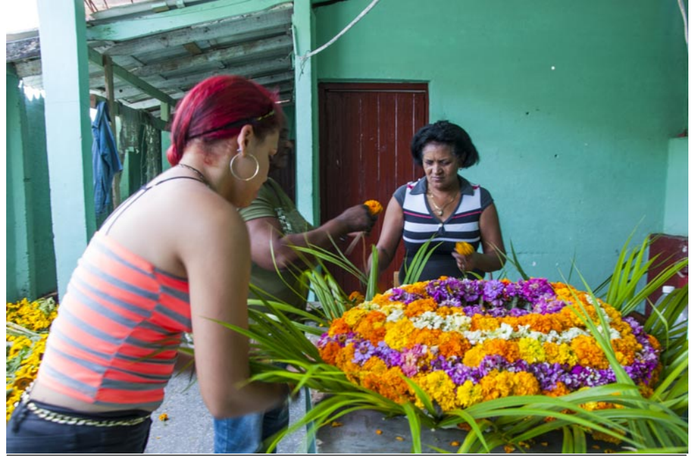
Comunales está muy lejos de cumplir con la demanda de flores de la población pinareña

La puesta en funcionamiento del incinerador "pica y se extiende". Entre permisos, compra de recursos, contrataciones e inestabilidad en la dirección del sector de Comunales, la ejecución de este proyecto supera los cuatro años.