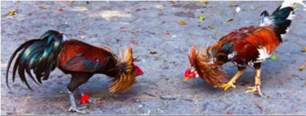
Las apuestas en las vallas se han convertido en un fenómeno que prolifera con el paso del tiempo

Ganar es solo cuestión de la casualidad; sin embargo, los apostadores llevan siempre las de perder. Solo queda analizar riesgos y beneficios, para darnos cuenta que no vale la pena sobreponerlos a la familia, dar paso a la violencia y a las pérdidas económicas, las cuales solo consiguen hundirnos en la marginalidad y convertirnos una vez más, en perdedores del juego de la vida.