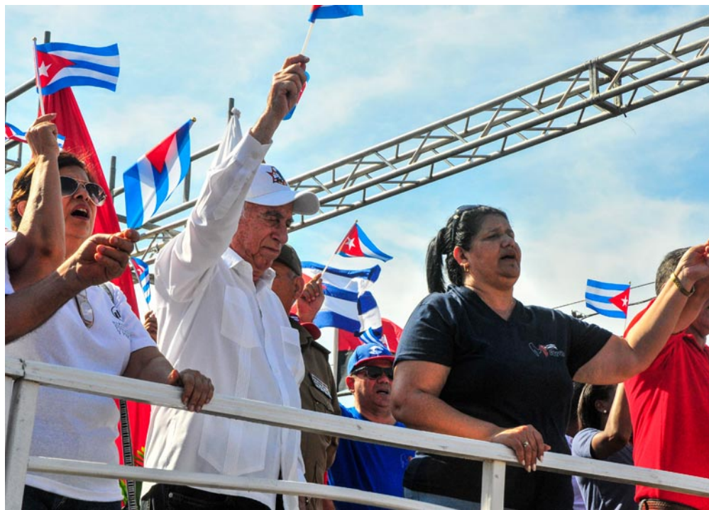
José Ramón Machado Ventura, segundo secretario del Comité Central del Partido presidió el desfile por el Primero de Mayo en Pinar del Río