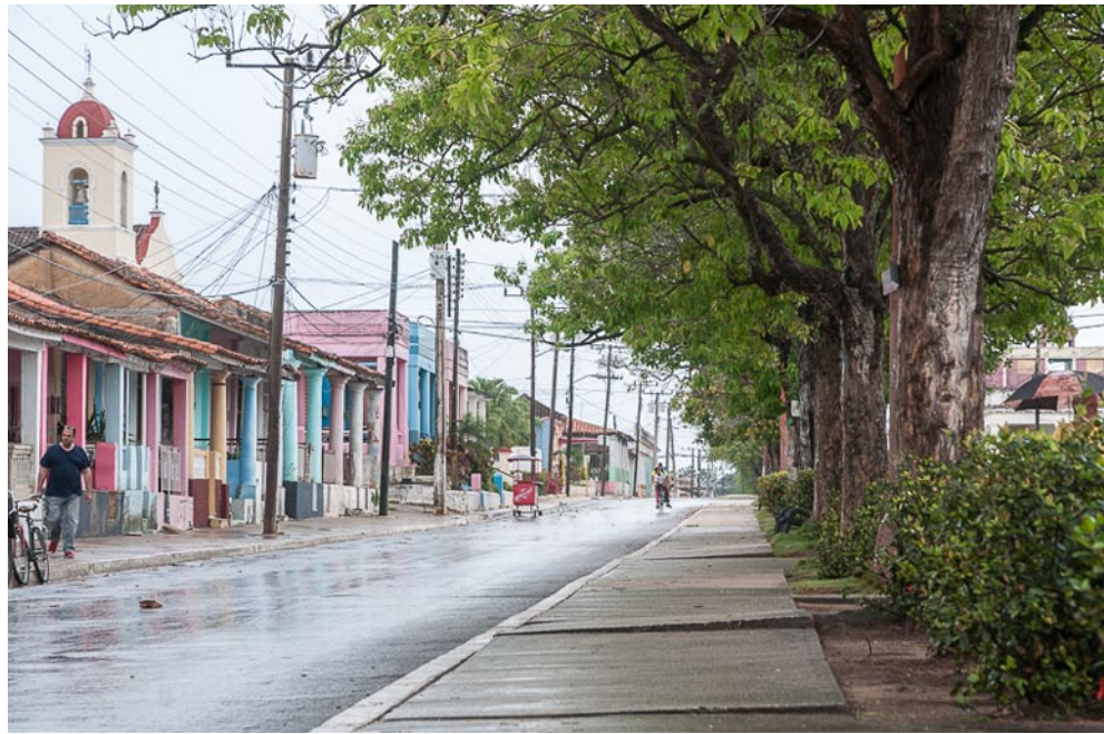
Separador en la avenida Juana Romero

Este hombre apasionado pasa sus días en los archivos, haciendo trabajo de campo y escuchando testimonios de gente diversa. Un tacho negro de ingenio o las baldosas de una casa en ruinas, son para él objetos preciados, que hablan más de la historia que los propios libros de texto.