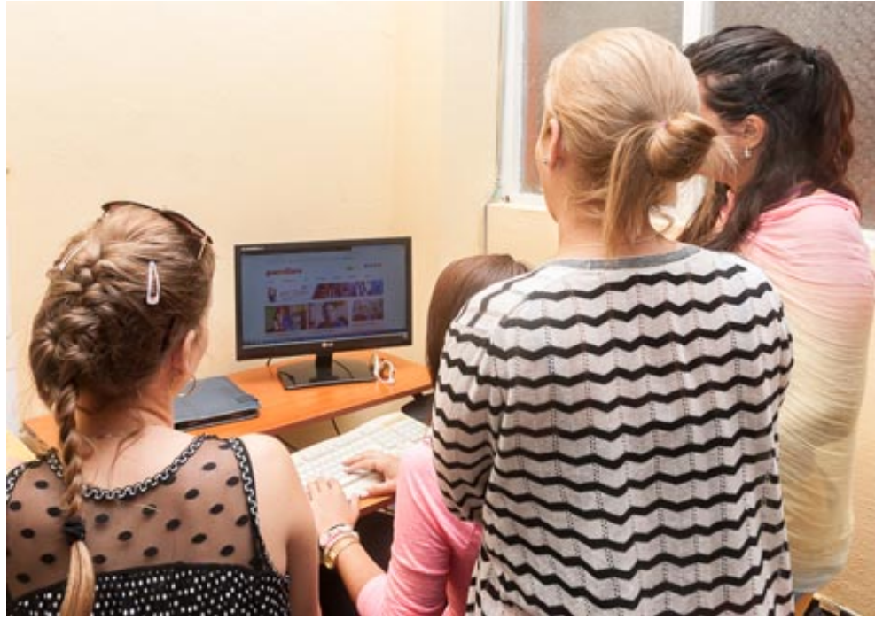
Periodistas de Guerrillero participaron en una entrevista online sobre los retos del periodismo en Cuba