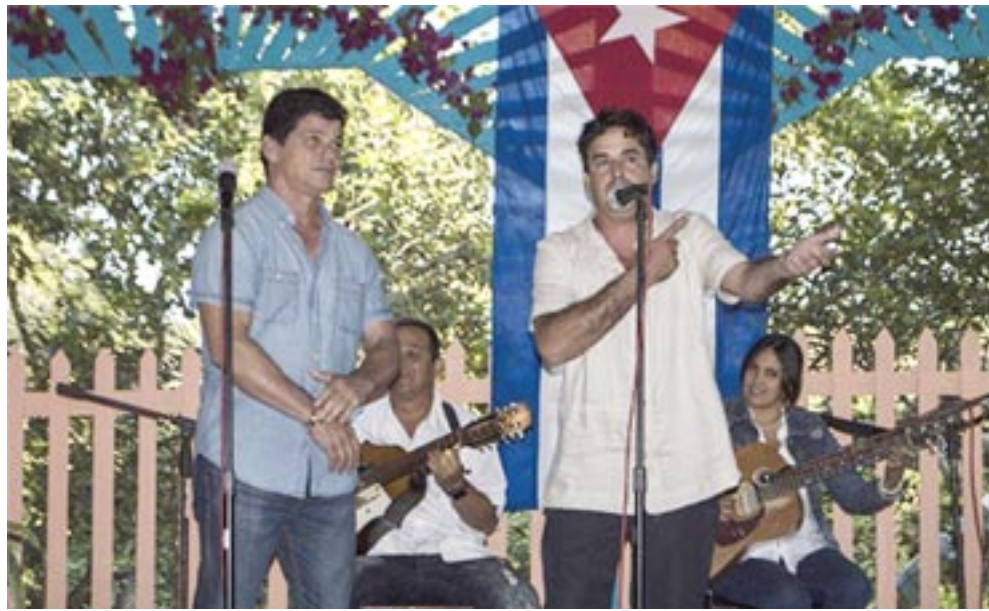
La Casa de la Décima rescata personalidades y escritos

Con guateque y literatura continuará la fiesta literaria. Durante todo el fin de semana habrá diferentes espacios para mantenernos al día con las letras.