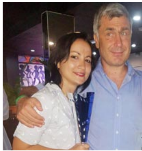
Yerisbel junto al Gran Maestro ucraniano Vasili Ivanchuk

La próxima aparición de las pinareñas en el escenario competitivo nacional será en un torneo por invitación que acogerá la ciudad de Camagüey en el mes de septiembre.