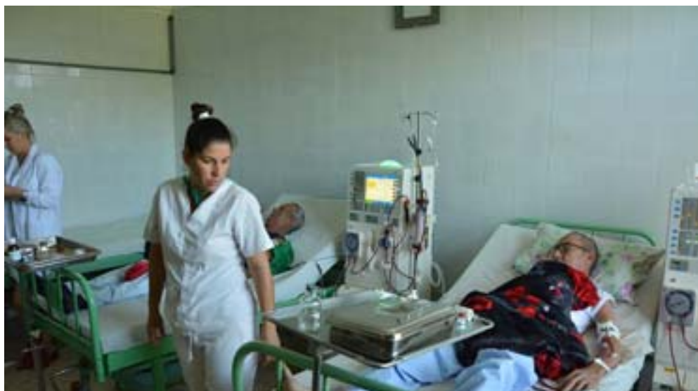
El servicio de Hemodiálisis del Hospital lleva 15 años mejorando la calidad de vida de pacientes que sufren de insuficiencia renal en estadio 5