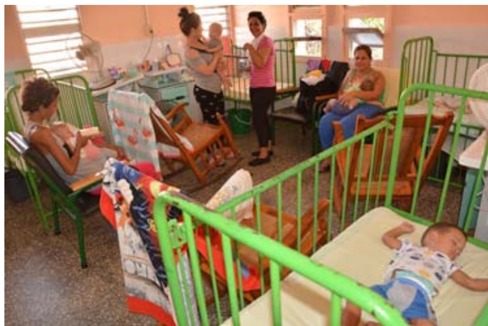
La mayoría de los ingresos pediátricos son por infecciones respiratorias

El equipo de enfermeras y médicos, junto a los pacientes de la sala funcionan como una familia. El servicio de diálisis, al igual que las demás especialidades en el hospital Augusto César Sandino son una garantía de la salud en el occidente cubano.