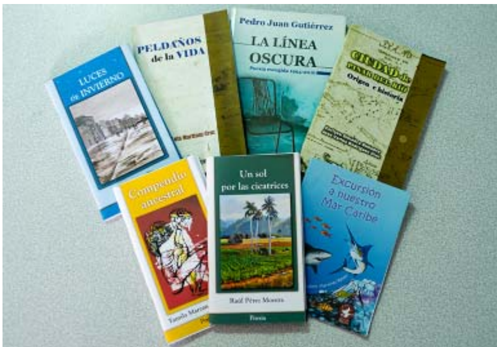
Algunos de los títulos incluidos en el catálogo de la editorial este año.

«Lo primero que debe hacer un autor inédito es ir a las casas de Cultura, donde