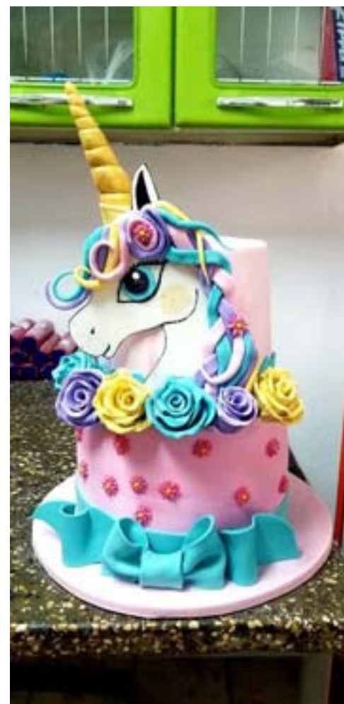
Trabajo concebido para el cumpleaños de una niña

A veces se metía a explorar el interior de aquel sitio y a conversar con los reposteros. Una llama pequeña ardía desde entonces en él, sin que presintiera que aquel oficio se convertiría, más tarde, en el eje de su vida.