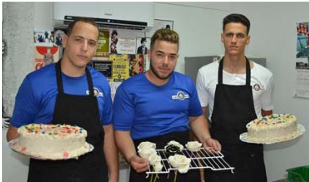
El equipo completo de Adrian's Cake

“Somos un buen equipo. Hay empatía y amistad y creo que eso es fundamental para que las cosas marchen bien”, prosigue.