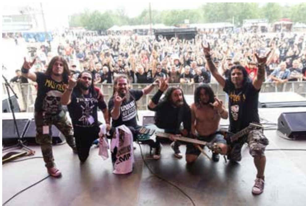
Tendencia en su gira por Alemania durante el 2018

En el 2006 conquistaron el interés de la compañía española Santo Grial Producciones, que los llevó otra vez de gira, en este caso a España, donde compartieron escenario con bandas reconocidas como Barón Rojo, Avalanch, Fe de Ratas, Medina Azahara y participaron en los festivales Derrome Rock (el más importante de Asturias) y en el Rock e Motos en Galicia (uno de los más grandes del país ibérico).