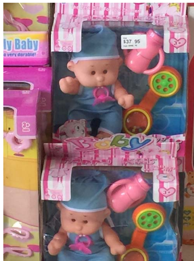
Los altos precios de los juguetes los hacen inalcanzables para un gran porcentaje de la población

Cierto es que muchos niños cubanos (los que tienen posibilidades) se inclinan por los juegos y las múltiples opciones de la computación, sin embargo, nos corresponde incentivar el interés hacia los juguetes tradicionales y hacia aquellos que les permiten desarrollar habilidades cognitivas y sus relaciones sociales.