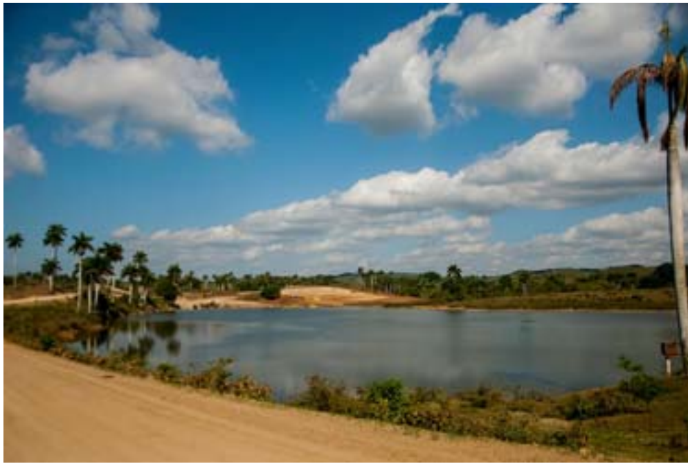
Vista panorámica de la micropresa

“Creo que somos privilegiados, pues contar además con agua para el riego de las plantas proteicas que se utilizan para la alimentación del ganado es de vital importancia para el desarrollo y crecimiento interno como UEB dentro de la Empresa”, concluyó.