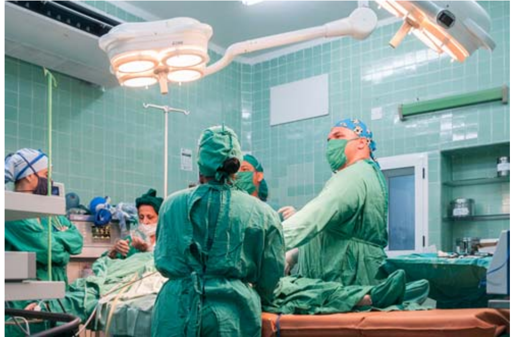
Los quirófanos quedaron como nuevos y eso es garantía y confianza para la familia; además facilita el desempeño médico

El hospital es antiguo, pero los pinares pueden prolongar su vida, siempre que lo cuiden, apoyen a sus empleados, mantengan la higiene dentro de los edificios y en el entorno y protejan sus muebles y equipos.