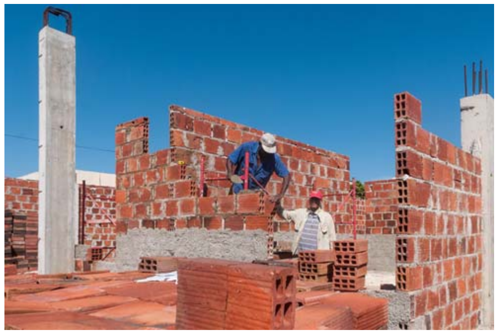
Cada día crecen las paredes del futuro Cuerpo de Guardia, que podría terminarse para el próximo año y se espera la mayor prontitud y calidad en el empeño de la brigada del Micons

La consigna de elevar la satisfacción de las necesidades es una frase en todos los servicios, pero en el caso de la Salud, máxime en la Pediatría, no es un simple compromiso, es una obligación.