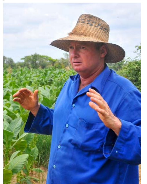
El hijo, digno heredero del padre, encuentra en la tierra la motivación mayor para ser feliz