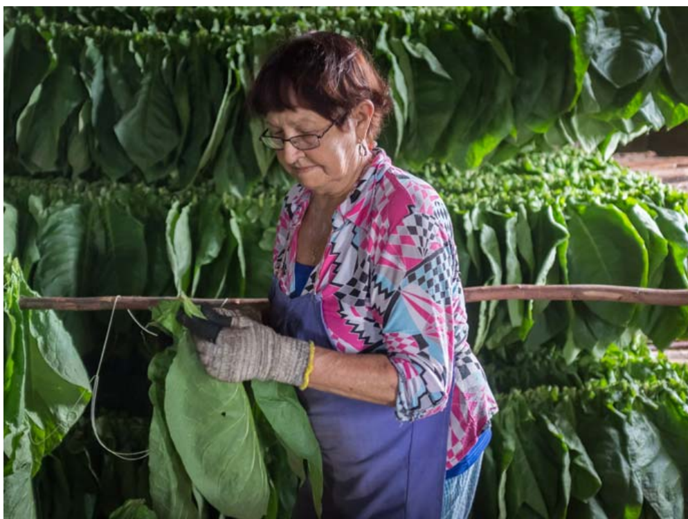
Nono es de las mujeres más “largas” en el ensarte, una actividad que con el tiempo ha valorizado su pago