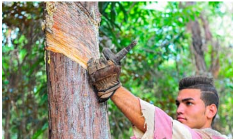
La resina de pino es otra de las líneas de producción exportables de importancia para Forsimac