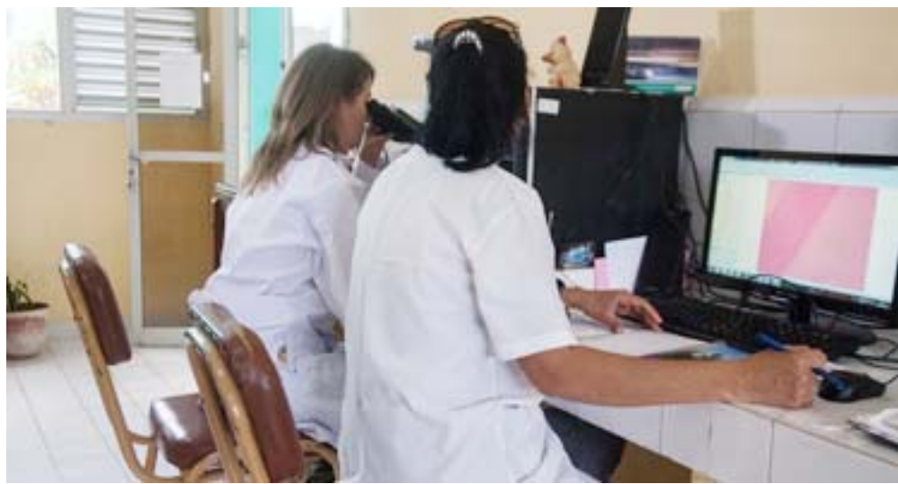
El prestigio del INCA es reconocido nacional e internacionalmente; acrecentarlo es reto diario para estas mujeres