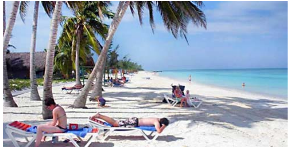
En Cayo Levisa acometen acciones para mitigar los efectos del cambio climático.

"Otro factor es la capacidad organizativa para emprenderlo con el objetivo de alcanzar una actuación eficaz que incluye la necesidad de anticipación, identificar vulnerabilidades, evaluar los riesgos, analizar y comprender los peligros a que nos enfrentamos e insertar los resultados en los procesos de planificación de la economía", expresó el delegado.