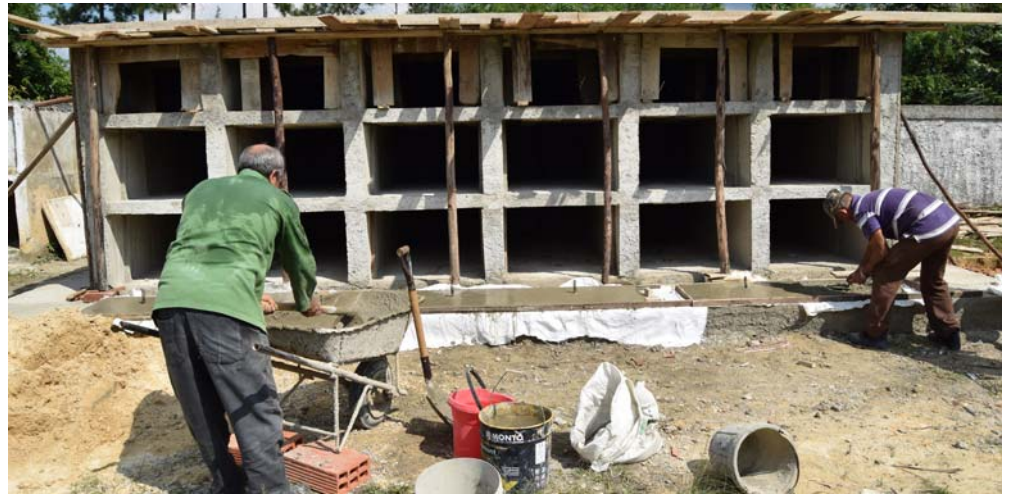
El nuevo nicho ya ejecutado era una de las deudas de Comunales con el pueblo de Viñales

Viñales también prepara condiciones para la creación de un nuevo vertedero, respaldado por una inversión millonaria de dos millones de pesos, que traerá consigo un lugar para el vertido de desechos sólidos con todas las características de un país desarrollado, incluyendo opciones de reciclaje.