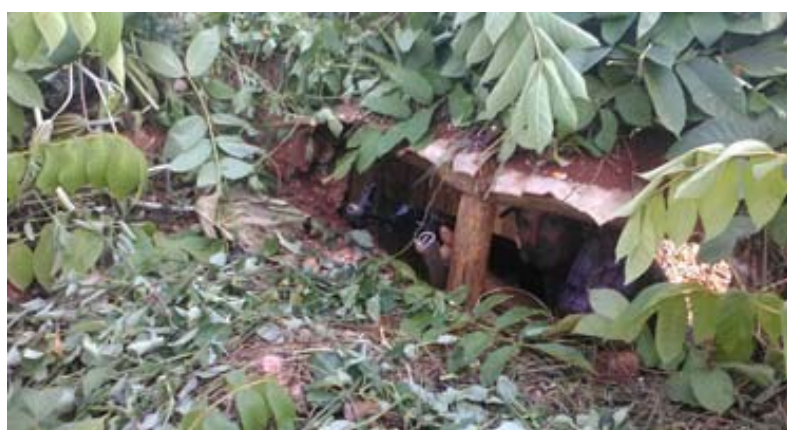
Los miembros de la BPD en la defensa de un objetivo