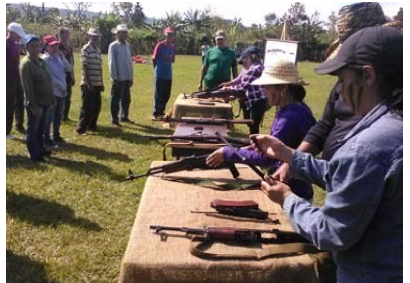
Ejercicios de arme y desarme con el fusil AKM