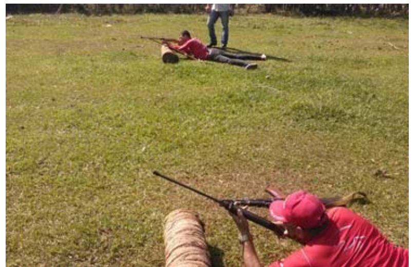
Entrenamiento de tiro al blanco con el fusil automático