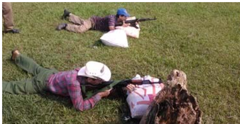
Alineación de los órganos de puntería y lanzamiento de granadas

Durante la práctica, el General de Brigada Onelio Aguilera Bermúdez y jefe del Ejército Occidental, elogió a la zona por su nivel de preparación y la demostración exhaustiva de los ejercicios realizados.