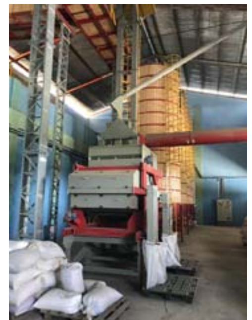
Estos nuevos silos permiten aumentar alrededor de ocho veces el antiguo ritmo de trabajo

“En general estamos hoy al 75 por ciento de las cifras propuestas para el caso del frijol. Algo a destacar es que, sin importar los números anteriores, el plan ya