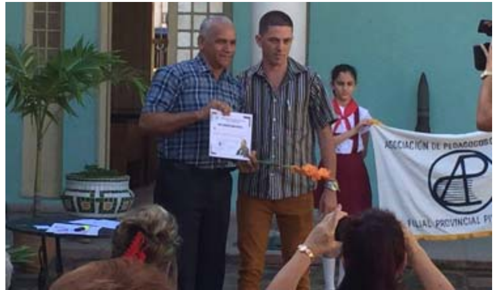
Fundadores y educadores con una vida activa en la APC recibieron reconocimientos