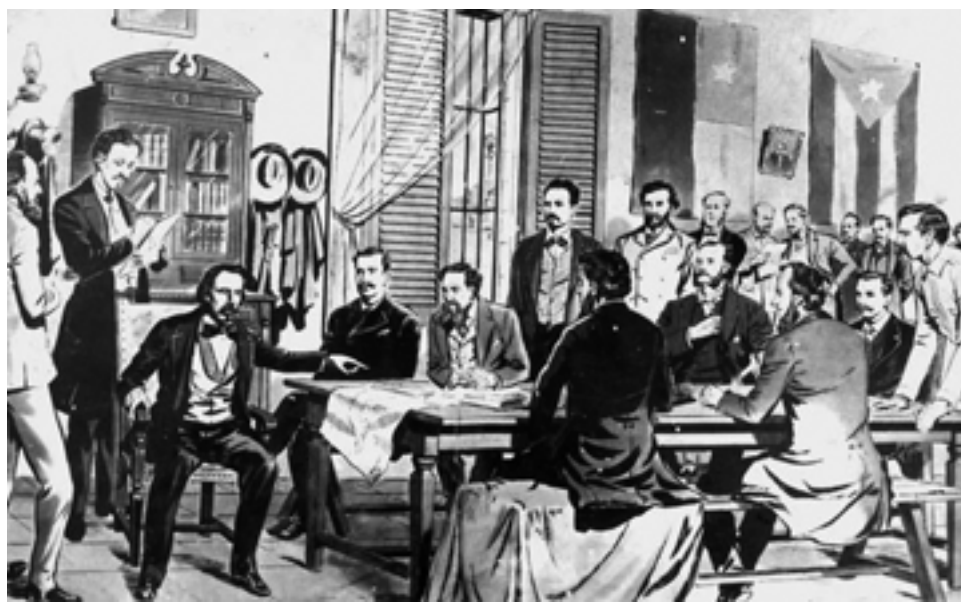
Céspedes tuvo protagonismo en la Asamblea de Guáimaro de la que emergió nuestra primera Constitución. Su apego a esta Carta Magna y a las leyes le llevó a acatar su destitución

Sobre el patriota escribió Martí en su artículo Céspedes y Agramonte verdades que erizan la piel: