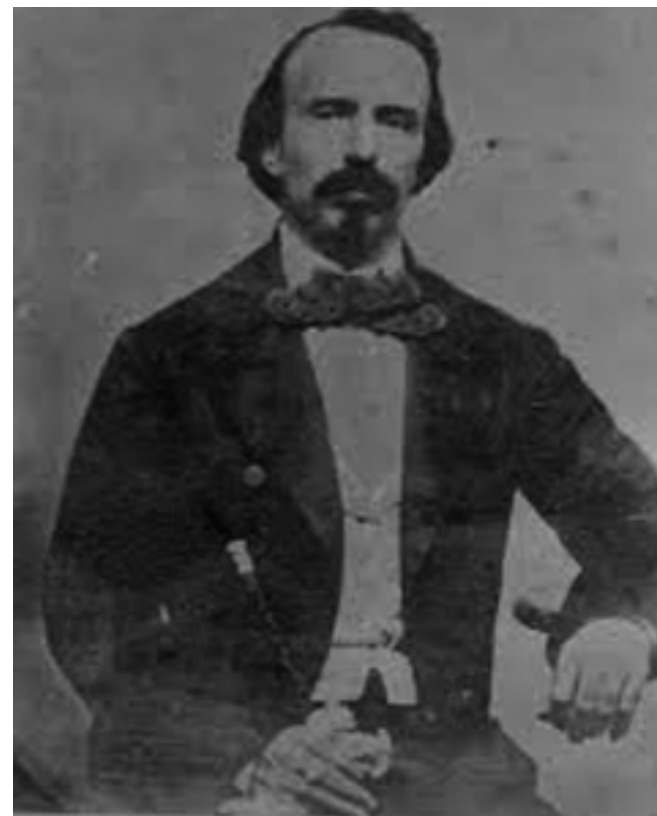
La injusticia contra él provocó que quedara solo frente a sus perseguidores

Más adelante refiere el autor: “...¡Mañana, mañana sabremos si por sus vías bruscas y originales hubiéramos llegado a la libertad antes que por las de sus émulos; si los medios que sugirió el patriotismo por el miedo de un César, no han sido los que pusieron a la patria, creada por el héroe, a la merced de los generales de Alejandro; si no fue Céspedes, de sueños heroicos y trágicas lecturas, el hombre a la vez refinado y primario, imitador y creador, personal y nacional, augusto por la benignidad y el acontecimiento, en quien chocaron, como en una peña, despedazándola en su primer combate, las fuerzas rudas de un país nuevo, y las aspiraciones que