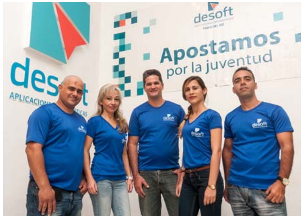
Este colectivo de Desoft asumió la tarea con mucha responsabilidad

● El portal del ciudadano Redpinar hace unas semanas fue noticia, porque es el proyecto cubano nominado a los premios 2019 de la Cumbre Mundial de la Sociedad de la Información