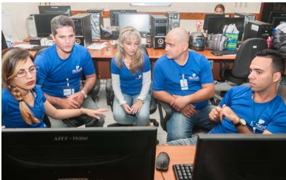
Son un equipo muy unido, más que compañeros, son amigos

Todavía en pañales, por el corto tiempo de su creación, el portal de Pinar del Río cosecha éxitos. El futuro aún puede ser mejor, a partir de las diferentes etapas por las que tiene que cursar la iniciativa, al final debe seguir fortaleciéndose como un gobierno electrónico con todas las posibilidades y opciones para los ciudadanos.