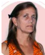
Por Ana María Sabat González

N UNCA he sido partidaria de reflejar en la prensa mis problemas particulares o lo que me suceda. Me parece que si lo hago violo algún principio de la ética periodística; tampoco suelo hablar en los comentarios en primera persona, sin embargo, esta vez creo que es necesario.