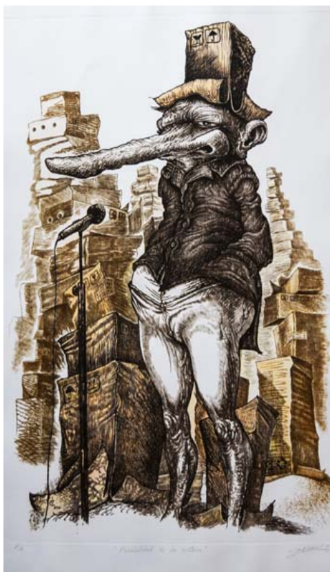
El artista Yasser Curbelo Rego exhibe Crónicas modernas, del 24 de enero al 24 de febrero, en la galería Arturo Regueiro de la capital pinareña

Los personajes están descontextualizados respecto a una época, un país, un oficio... son personalidades en apariencia inexpresivas y por ello nostálgicas, resignadas y hasta sosas. Surgen distinguidos unos de otros con jerarquizaciones implícitas. Los unos, ataviados con sombreros (de cajas, platos, gorros de cumpleaños) y sacos que les otorgan cierta alcurnia social comparados a los otros: fantasmales y trágicos, colgados y apresados de manos, vestidos con pijamas, expectantes a merced de los primeros, decorativos, en una escena que no protagonizan.