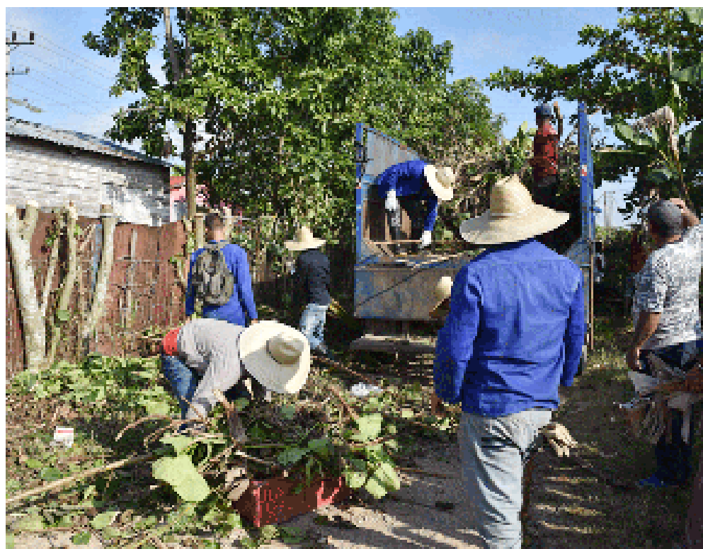
Los habitantes del "Cuba Libre", de conjunto con los trabajadores de Servicios Comunes, realizan el saneamiento de patios y limpieza de distintas áreas

Esas con las razones que convocan al pueblo, y es cierto que a veces falta el agua, hay dificultades con el transporte o la solución a determinada carencia se prolonga en el tiempo, pero los agradecidos van hacia la luz, y desde ahí deshacen sombras. Por estos días el consejo popular Cuba Libre es un permanente albor.